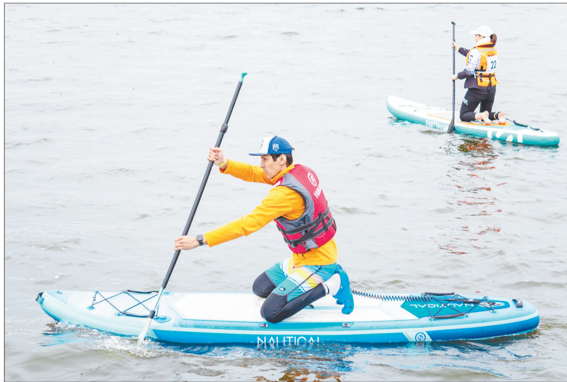
Встречный ветер и боковая волна не стали помехой для новичков, которые смело приняли участие в заплыве на 4 километра

На территории парк-отеля «Новая земля» СП «Татнефть-Забота» прошел фестиваль сапсерфинга