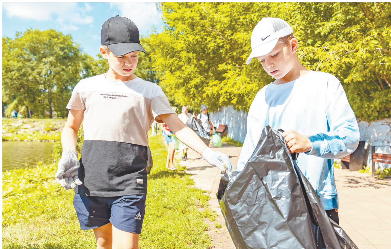
Во время уборки на каскаде прудов чаще всего ребятам попадались стеклянные бутылки и пластиковая упаковка