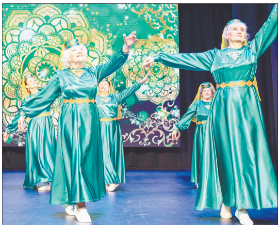
Дворец культуры Лениногорска в 2023 году на средства гранта Компании обновил на сцене светодиодный экран

Сохранению и укреплению культуры многонационального народа республики, возрождению многовековых традиций способствует фестиваль «Каракуз», объединяющий людей разных культур. В этом году он проходит с 19 июля по 4 августа.